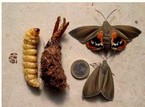
Phases du cycle de Paysandisia archon (œufs, larve, cocon et imagos)

Comment protéger les palmiers d'une contamination ? Que devez-vous faire si votre palmier est attaqué ?