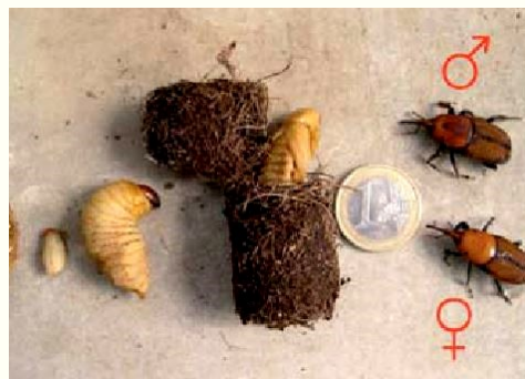
Phases du cycle de Rhynchophorus ferrugineus(œufs, larve, cocon et imagos)

Ses plantes hôtes sont de préférence : Trachycarpus , Chamaerops , Phoenix (palmier des Canaries) et au Jubaea (Cocotier du Chili) ; mais il attaque aussi Brahea , Butia , Livistona , Sabal , Syagrus , Trithrinax et Washingtonia .